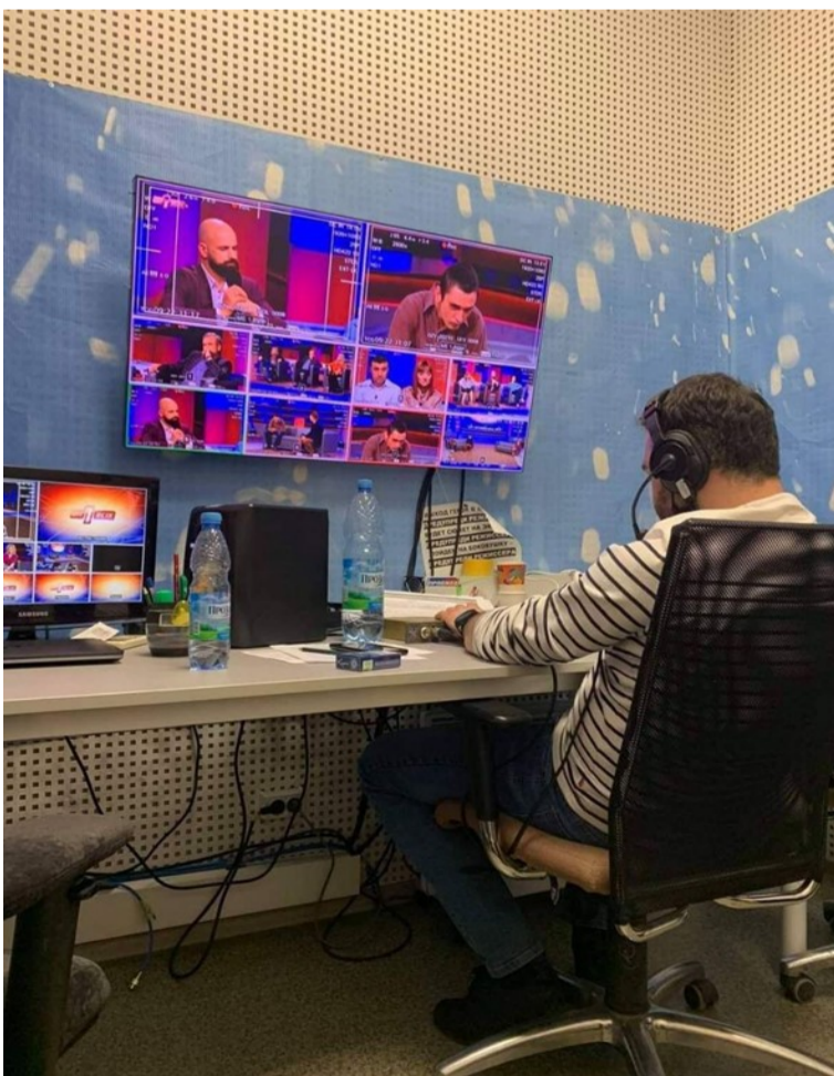
Робота над шоу «Один за всіх»

«Шеф-редактор повинен бути лідером! Людиною, яка зможе повести за собою команду..»