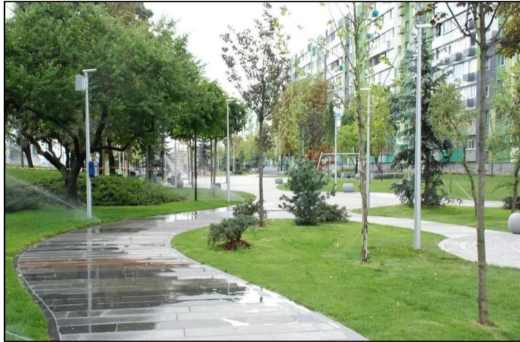
Ранковий полив газону

Друга частина скверу — це так звана ігрова зона, де знаходяться гральний майданчик, турніки для воркауту та велика спіральна гірка для дітей. На території скверу розташовані великі