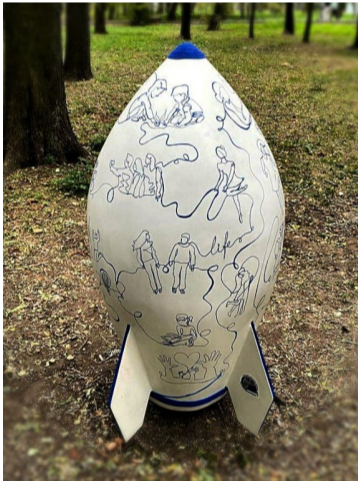
«Нероздільна лінія життя та майбутнього». Автор роботи: Оксана Семехіна, м. Дніпро. Робота виконана у незвичайній техніці — в один дотик. Лінія об'єднує персонажів, їхні емоції, дії та мрії. За час існування ми проходимо довгий, інколи складний, інколи прекрасний, але нерозривний шлях.