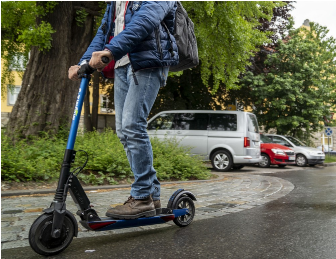
Один із видів транспорту, на якому студент долає шлях до університету

Деякі студенти хоч раз замислювались над тим, як дешевше та швидше дістатися до університету, адже не всі хочуть витратити дорогоцінний час на дорогу. Більшість наших студентів, які проживають в гуртожитку, дуже цінують свої кошти, тому обирають йти до навчального закладу пішки, щоб зекономити. А ось ті, хто живе значно далі, неодноразово перебирали в голові всі можливі шляхи, адже більшості хочеться якомога більше поніжитися в теплому ліжку.