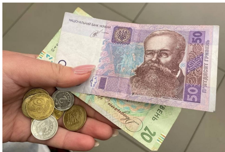
Кишенькові заощадження студента