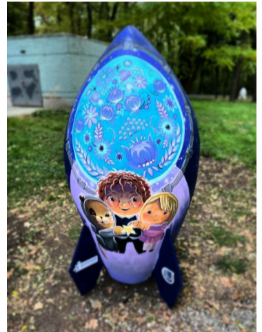
«Разом до зірок». Авторка: Альона Волошина, м. Дніпро. Per aspera ad astra! Людство завжди мріяло досягнути зірок, а сама робота символізує неоціненний вклад українських першопрохідців у підкоренні космосу.