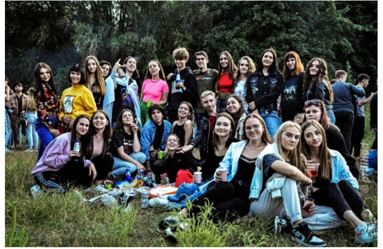
Дружня атмосфера на пікніку