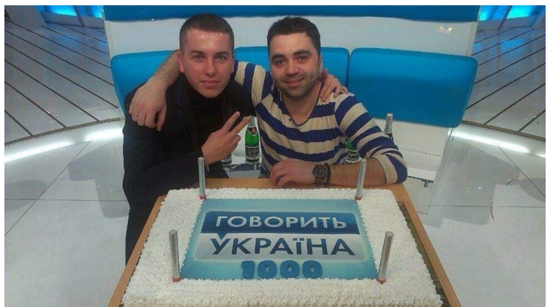
Робота у «Говорить Україна»