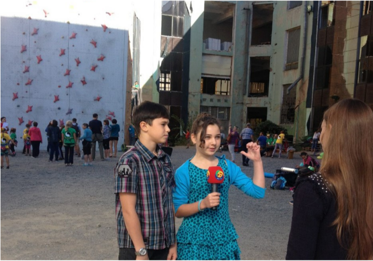
Перший репортаж у моєму житті. «Недорослі новини» 27 канал