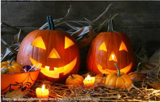
Головний символ Гелловіну – ліхтар Джека

Чому про Гелловін знають більше, ніж про Купала