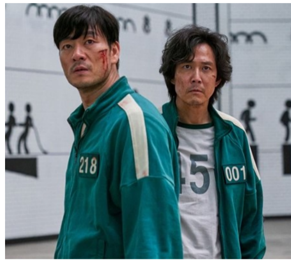
Вигляд костюмів з серіалу

Костюм наглядача онлайн магазин – 700 – 1000 грн/без урахування доставки; офлайн магазин – 1500 – 2100 грн.