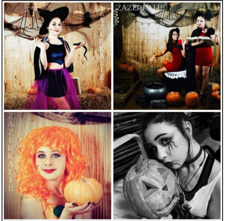
Фотосесія у «Задзеркаллі» та на вечірці у Штурмі.

Гелловін — сучасне міжнародне свято, історія якого бере початок на території сучасних Великобританії та Північної Ірландії. Святкується щороку 31 жовтня, напередодні Дня Всіх Святих. Все місто готує прикраси для святкування. Головний символ — гарбуз, з якого вирізають гримаси та кладуть у середину свічку для атмосфери свята. Гелловін святкують не один день, адже в різних кутках світу свої дати й своя програма.