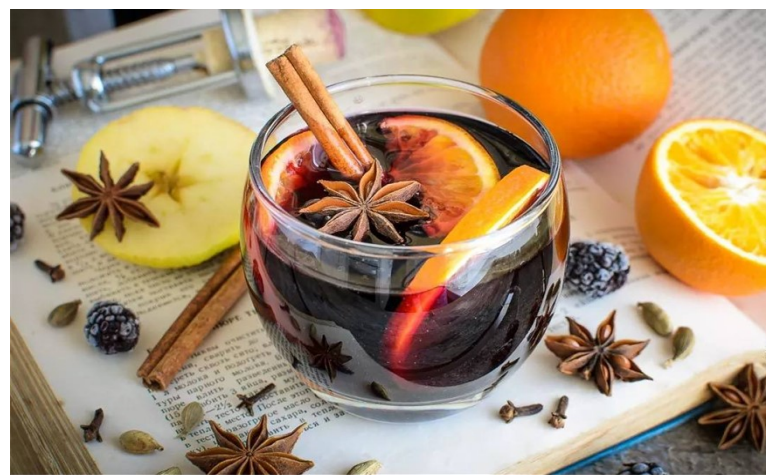
Після всіх святкових жасів, хочеться заспокоїтись та випити теплий глінтвейн сайт: vku.life