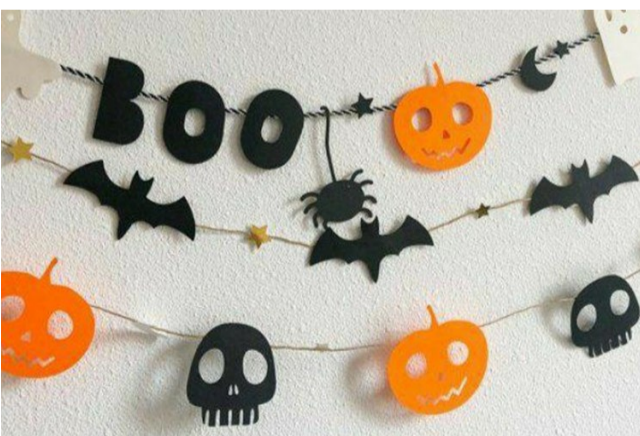
Яскраве оформлення стін гірляндою.

Основний атрибут Гелловіну – «Джек-ліхтар» або гарбуз із вирізаним обличчям. Середня вартість великої ягоди становить 15 грн/кг, а вага – від 1,5 до 5 кілограмів. Маленький гарбуз буде коштувати близько 22 гривні 50 копійок, середній, вагою у 2,5 кг – 37 грн 50 копійок, великий – 75 грн. Існують різні варіанти декорування: можна вирізати у гарбузі отвори у формі обличчя, або, якщо приділити цій справі більше часу – перенести на поверхню тематичні малюнки. Коли "основа" готова – встановлюємо до неї свічку. Упакування свічок коштує 160 грн/25 штук. Тобто, 6 грн/шт. Їх можна встановити у свічник або зробити його власноруч. Для цього необ-