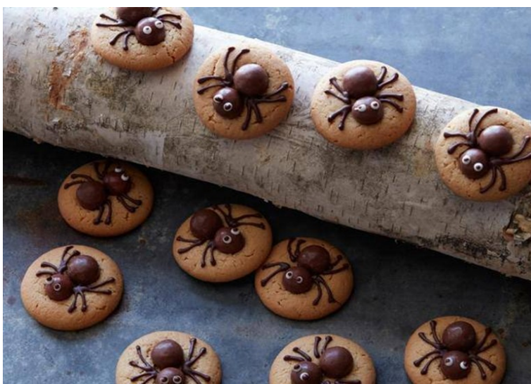
Печиво "Павуки" гарне частування для друга арахнофоба

Гостей будемо зустрічати чудернацькою закускою «Сосиски-мумії»