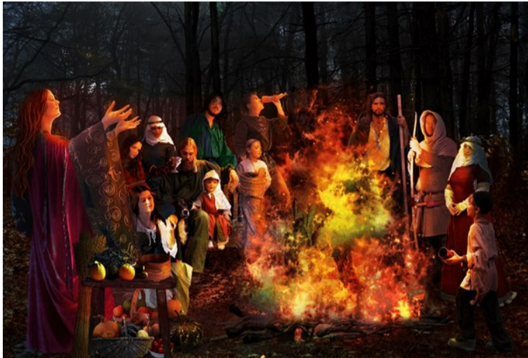
«Кельти святкують Самайн»

Покопавшись та знайшовши цікаві факти про головне свято осені, ми спробуємо розібратися в історії Гелловіну та розкрити всі карти: Що? Як? Та Чому?