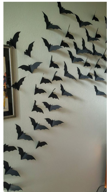
Декор паперовими кажанами. Pinterest.com