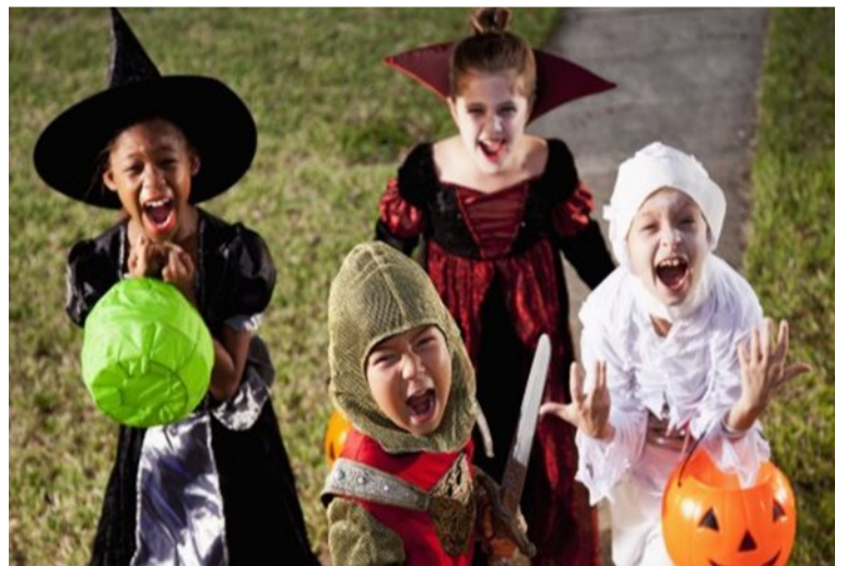
Дитячий «Trick or treat» у надвечір Гелловіна.