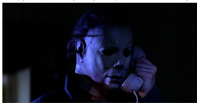
Кадр з фільму «Гелловін» 1978 року.

Про Геловін створюється дедалі більше фільмів та музичних композицій. Ці плоди творчої діяльності приваблюють не лише своєю атмосферою, а й образами, які закладено у роботах багатьох режисерів та музикантів. Настав час поринути у світ кіно та музики, який має пряме відношення до цього страшного свята!