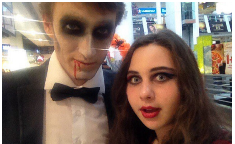
2016 рік, мій перший Гелловін у житті. Я підходила до людей у цікавих костюмах та фотографувалася з ними.