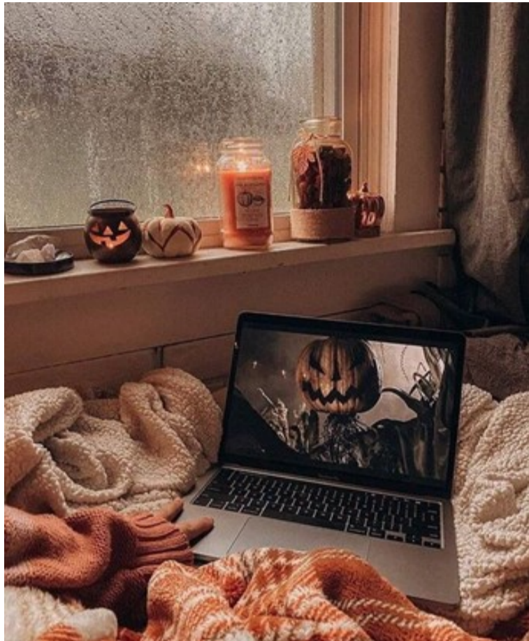
Зразок оздоблення кімнати на Гелловін.

Головним атрибутом Гелловіну прийнято вважати гарбуз, тому, якщо маєте одного вдома — виріжте з нього ліхтарик Джека. За відсутності можна використати будь-який інший