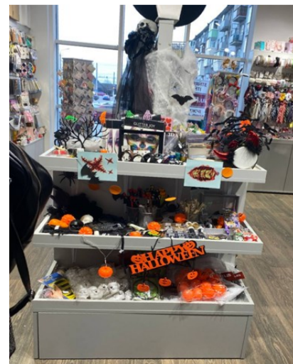
Магазин «Монпасьє», ТРЦ «Neo Plaza»