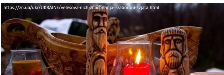
Святкування Велесової ночі