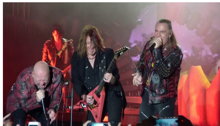
Учасники гурту Helloween дають концерт.