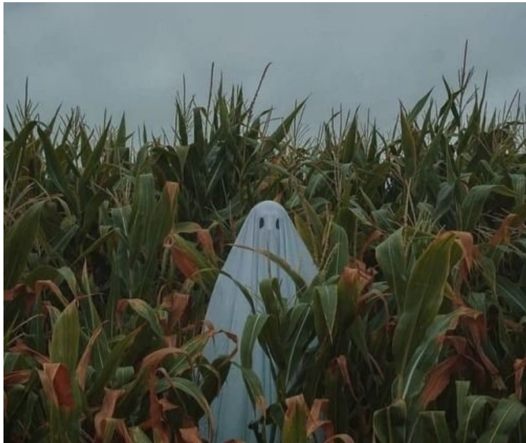
«Тематична фотосесія до свята Геловіну»

Геловін – свято, що близько 20 років святкується на території нашої країни. Українці неоднозначно сприймають «навечір'я усіх святих». Про те Геловін активно популяризується і святкується в Україні з початку XXI століття. Ми з'ясували як до запозиченого свята ставляться різні покоління українців і проаналізували відповіді.