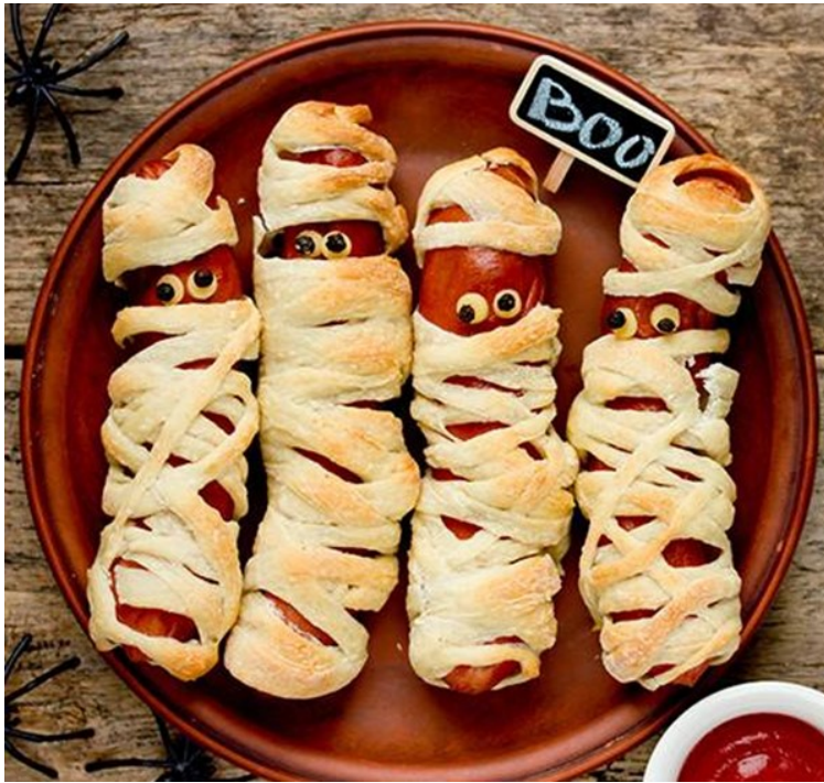
Буу. Сосиски-мумії – чудова страва, щоб здивувати та налякати гостей сайт: ideas/recipe_list

З появою в українському календарі свята Гелловін ми отримали не лише ще один день веселощів, але й набагато більше – відтепер можна проявити фантазію у пошуку чудернацьких костюмів та, звичайно, показати свою кулінарну майстерність. Чим страшніший вигляд матиме страва, тим більше враження вона справить на ваших гостей. Та от що ж вигадати, аби їжа на столі була виконана у стилі Гелловіну та й до того ж смачною? У нашій статті ми створили ціле меню до вашого свята.