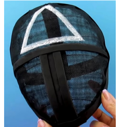
Готовий вигляд маски