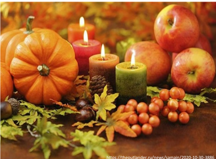
Приклад святкового алтаря