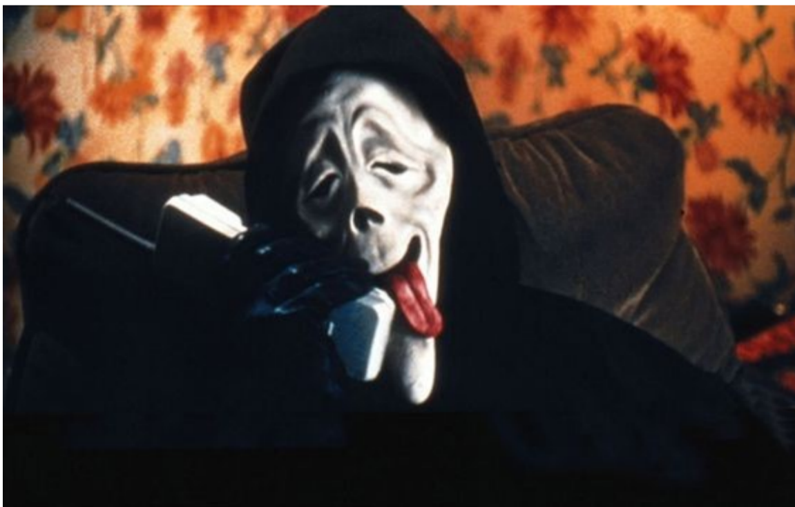
Кадр із фільму «Дуже страшне кіно» (2000), реж. Кінен Айворі Веянс