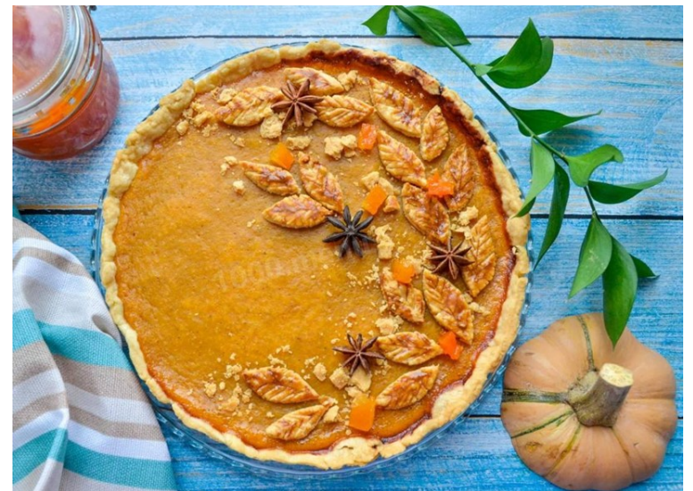
Навіть найжасливіша вечеря не обійдеться без класичного гарбузового пирога сайт: 1000.menu/cooking