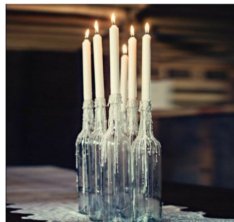
Бюджетний варіант свічника. Pinterest.com

ти найлегше. Далі з'єднуємо їх за допомогою скочу чи робимо спеціальні отвори та просуваємо через них нитку. Щоб елементи гірлянди вийшли симетричні, треба скласти папір навпіл та перенести на нього половину очікуваного зображення. За таким принципом робимо кажанив та павуків, яких закріплюємо на стіні. Ще один спосіб декорування простору – павутиння. Для