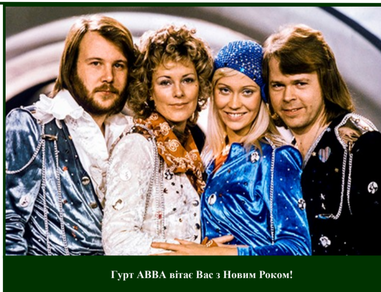
Гурт ABBA вітає Вас з Новим Роком!