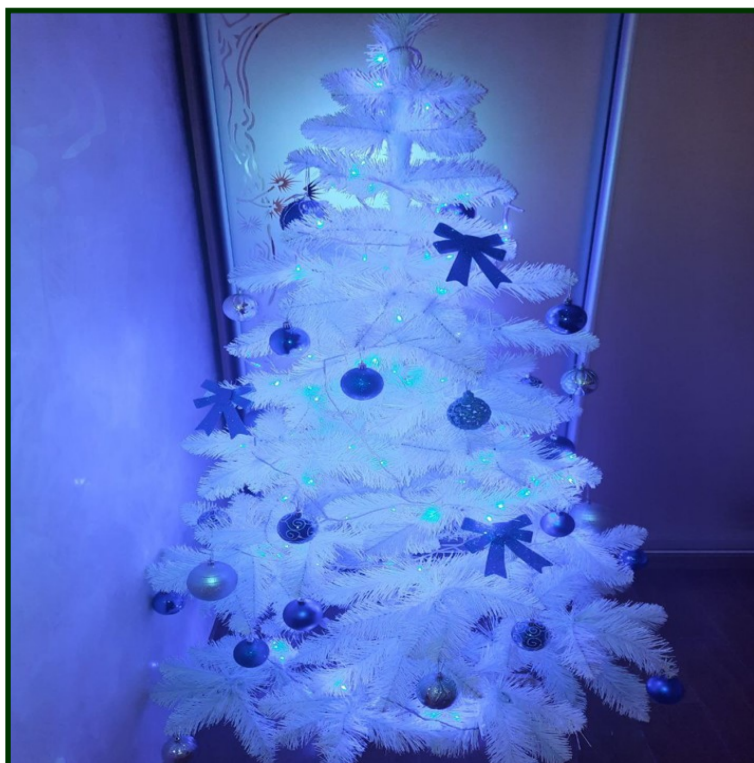
Новорічна красуня однієї із студенток

FrankSinatra — Let It Snow Пісня, що давно стала впізнаваною у всьому світі.