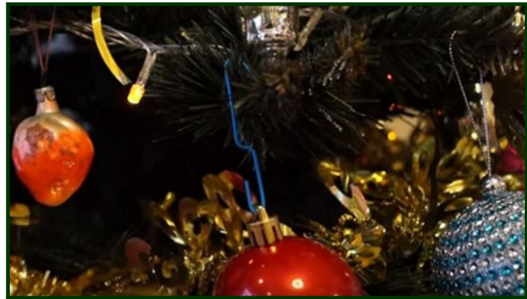
Скріпки та «вухка»

Упевнені, більшість ваших ялинкових іграшок – без петель для підвішування. Щоб не займатися стомлюючим зав'язуванням мотузочок, скористайтесь канцелярською скріпкою. Легким способом розігніть її у різні боки. Один кінець-гачок втягніть у вушко іграшки, інший – зачепіть за гілку ялинки. Зручніше!?