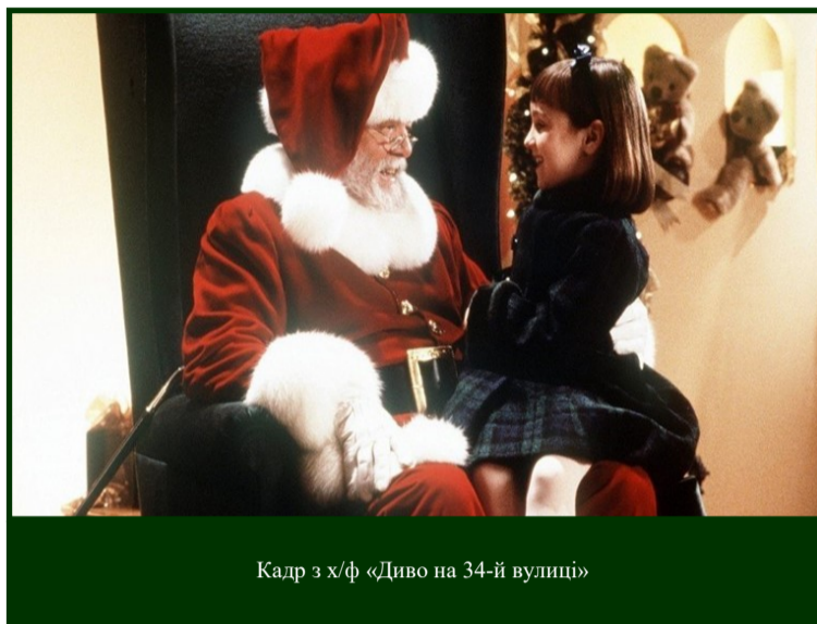
Кадр з х/ф «Диво на 34-й вулиці»

Коли ваша кімната нарешті прикрашена і сповнена атмосферою свята, самий час зібратися у сімейне коло та переглянути новорічні фільми! Кожного року різдвяні свята збирають біля екранів телевізорів цілі родини, а тематичні кінострічки піднімають людям чарівний святковий настрій. Авжеж можна подивитися усім відомий фільм "Один вдома", але чому б не урізноманітнити вибір