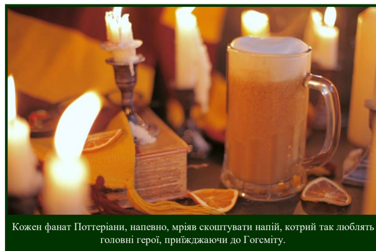
Кожен фанат Поттеріани, напевно, мріяв скоштувати напій, котрий так люблять головні герої, приїжджаючи до Гогеміту.