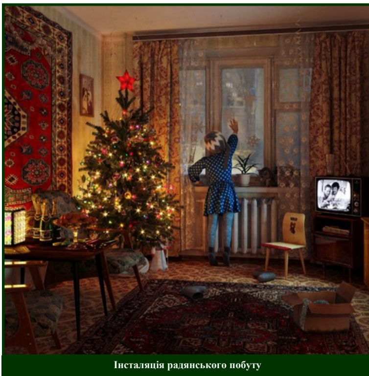
Інсталяція радянського побуту