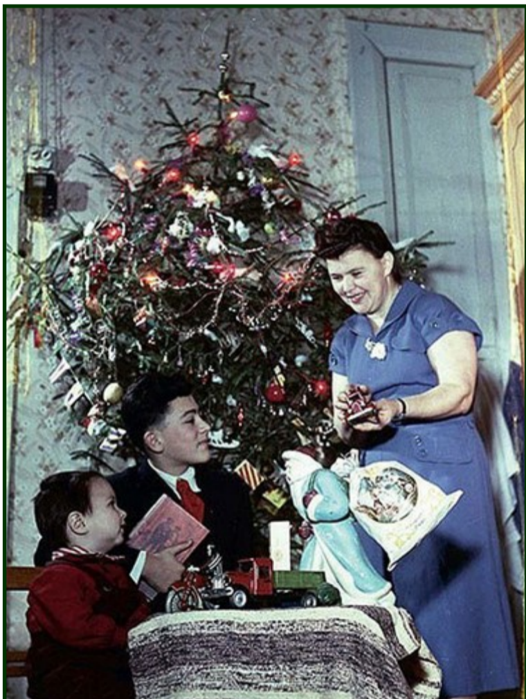
Знаменитий фотограф Еммануїл Євзеріхін зафіксував свою сім'ю біля ялинки, 1954 рік.

Незабаром новорічні свята, тож, гайда прогуляємось сторінками чарівної радянської епохи?