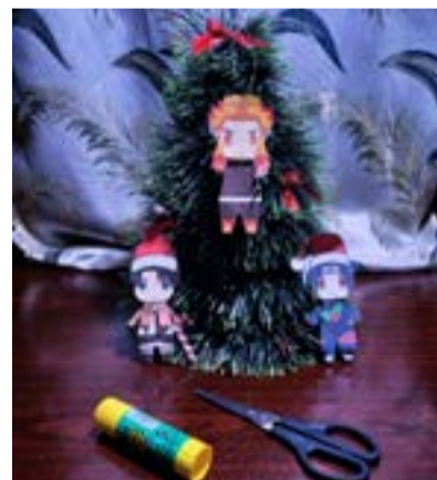
4. Фігурки на ялинці

Молодець, зараз можеш не кваплячись вирізати його, обережніше з білими куточками.