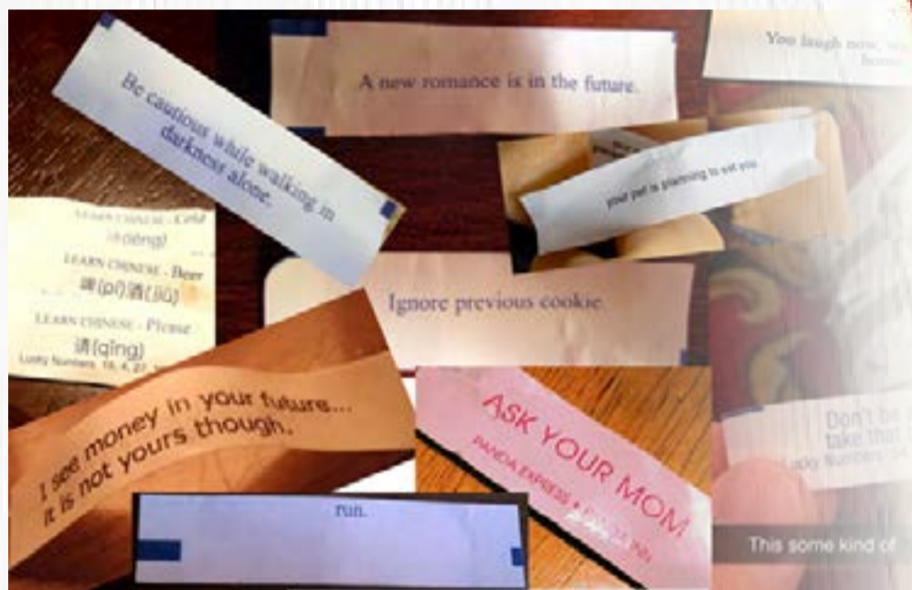
Побажання з печива взято з сайту: boredpanda.com

Новий рік – чарівний час подарунків, побажань, вогнів, наче потрапив у казку, яка триває лише одну ніч. Ми – студенти, на яких поклали велику місію – написати статтю до новорічного випуску «Гончар Інфо», щоразу ламаємо голову про що ж писати. Я – не виключення.