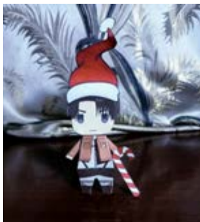
3. Готова фігурка

Однак мультяшні герої полюбляються всім, тому сміливо тисни «завантажити» та