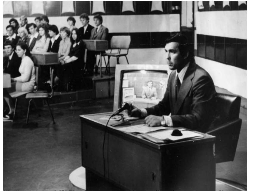
Майбутній декан ФСЗМК на Дніпропетровській обласній студії телебачення, 70-ті роки

Чи повинна людина, яка хоче займатися журналістикою, мати спеціальну освіту?