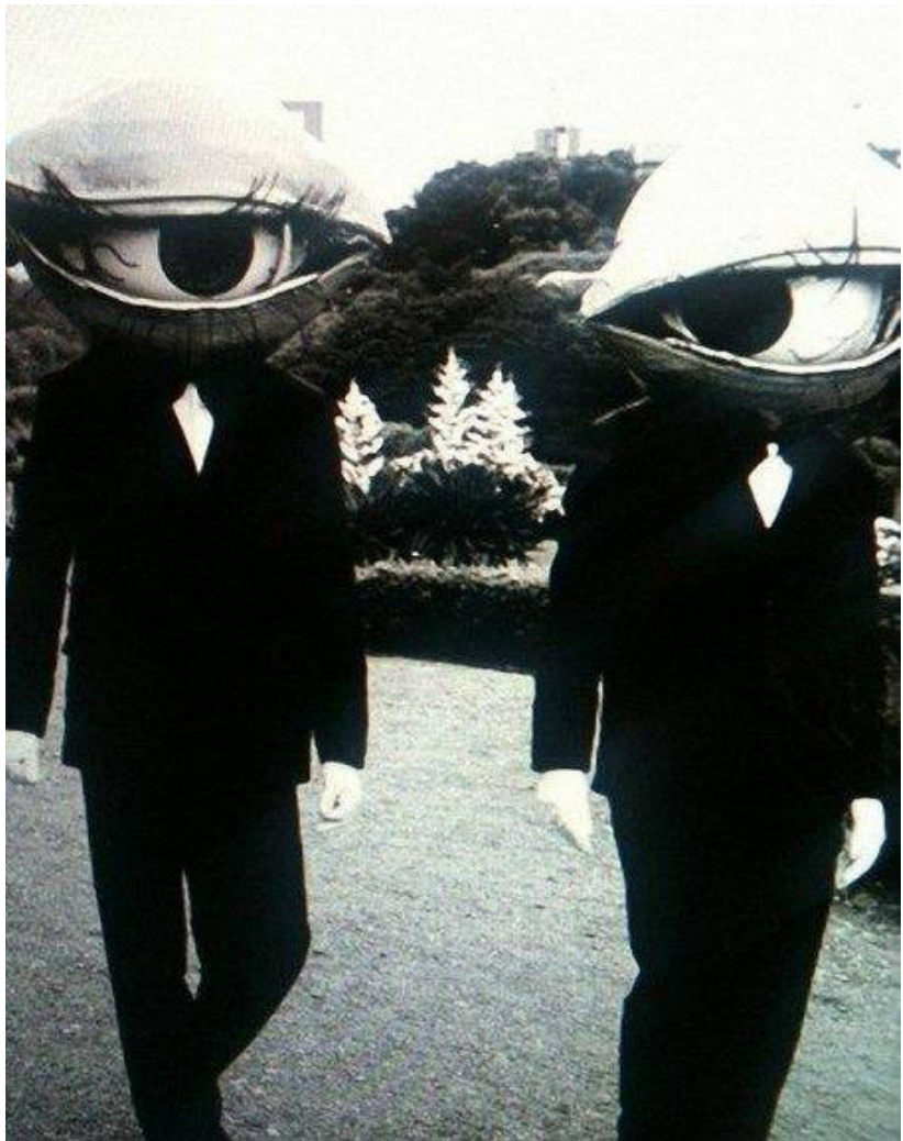
Перші хелоуїнські образи