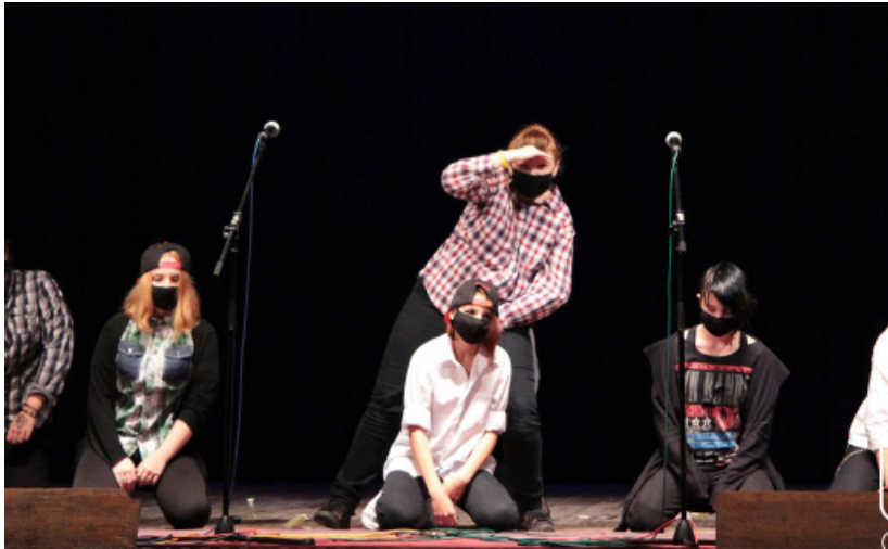
День першокурсника механіко-математичного факультету