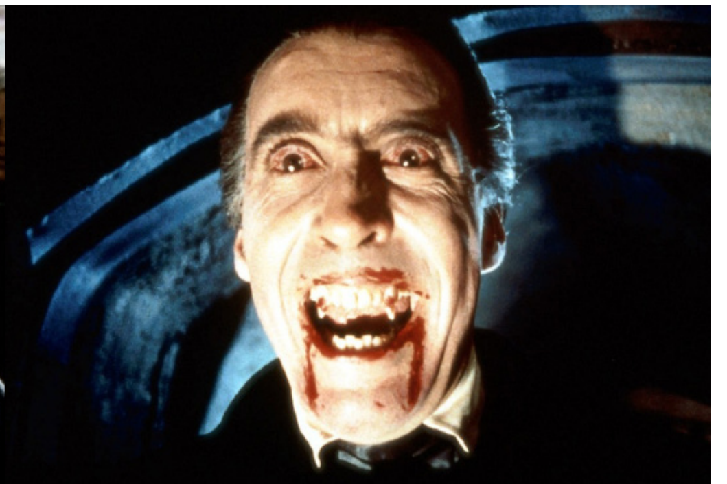
Кадр из фильма «Дракула»

Сегодня фильмы ужасов очень популярны, а в преддверии Хэллоуина они становятся еще более востребованной, но так ли они безобидны? Что пропагандируют эти киноленты, какой смысл мы можем вынести после просмотра?