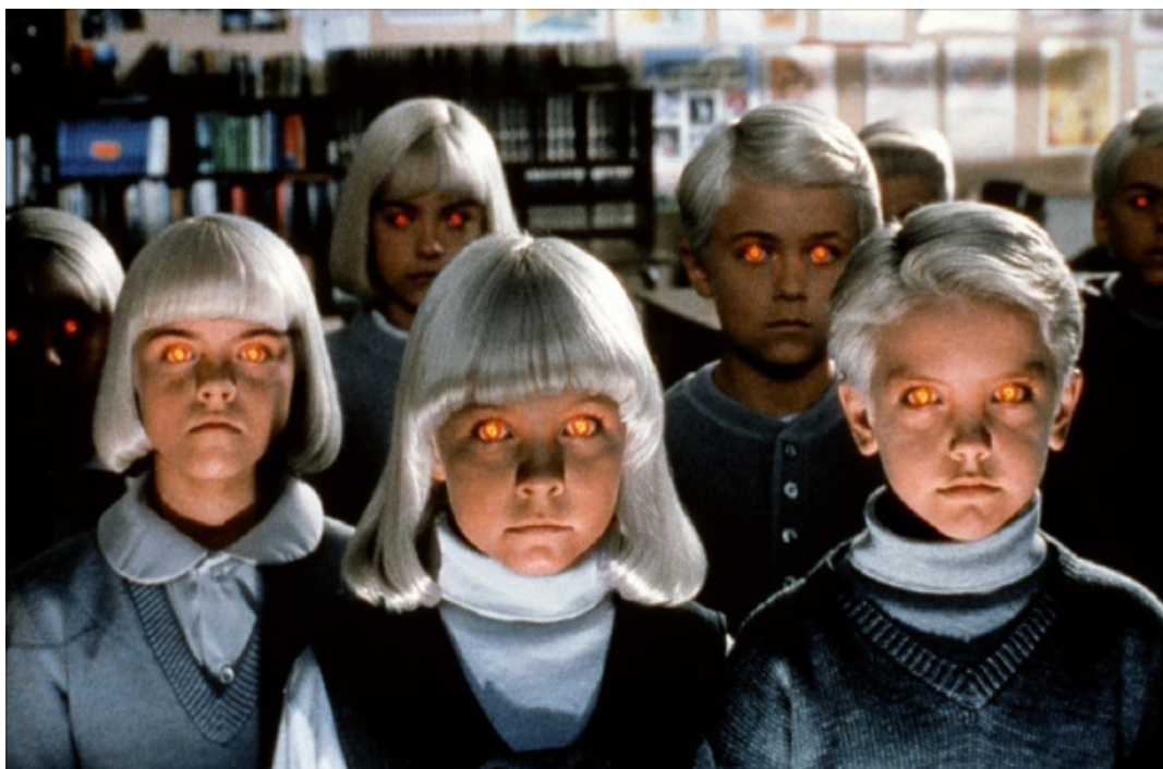
Кадр из фильма «Деревня проклятых»

или барометр, тревожащий современное общество