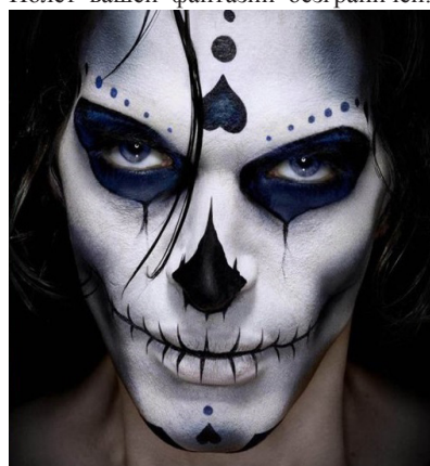
Грим для парня

Парни могут выбрать традиционный образ славноизвестного вампира Дракулы или же стать веселым и авантюрным пиратом Джеком Воробьем. Если же вы хотите быть нетривиальным, тогда присмотритесь к образам Волан-де-Морта, благородного Айвенго или же сильного Тора. Полет вашей фантазии безграничен.