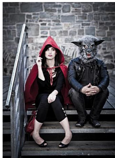
Образы для пар

Влюбленные, как правило, выбирают милые и романтические образы. Большой популярностью пользуются образы пары из фильма «Семейка Адамс», Бонни и Клайда, а также Эдварда и Бэллы – из фильма «Сумерки». А если же вы поклонники классики, то советуем преобразиться в нежную и трогательную пару Ромео и Джульетта.