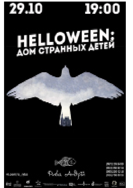
Праздничные афиши мероприятий Днепрпетровска

В праздничную неделю достаточно легко найти место, где можно отдохнуть и развлечься 99,9% заведений предлагают «программу по праздничным ценам» - цены на билеты несколько ниже, а в тех же клубах появляются «страшные коктейли». Те же «Париж», «Искра», «Уткабар» организуют вечеринки и привлекают посетителей подарками.