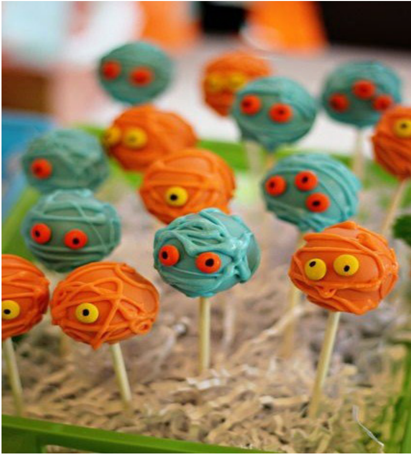
Кейк-попсы. Интернет-магазин сладостей «Mr Sweet»