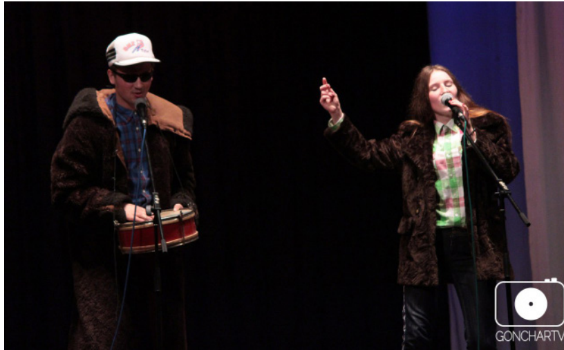
День першокурсника ФФЕКСу