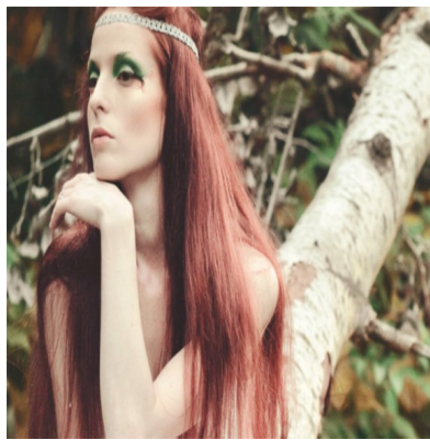
Українські образи на Хеллоуїн (зліва направо за годинниковою стрілкою вніз): Характерник, Мавка, Злидень, Попелюха

Столицями Хеллоуїну вважають Лос-Анджелес та Нью-Йорк. Тут проходить яскраві карнавали та нічні гуляння. Кожен рік 65% американців наряджають свої будинки та офіси. Свято, коли продається найбільше всього цукерок, а біля