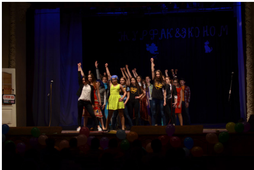
День першокурсника ФСЗМК та ЕФ

Початок нового навчального року завжди знаменується веселим святом – Днем першокурсника. Наші журналісти познайомились з новачками університету і діляться своїми враженнями.