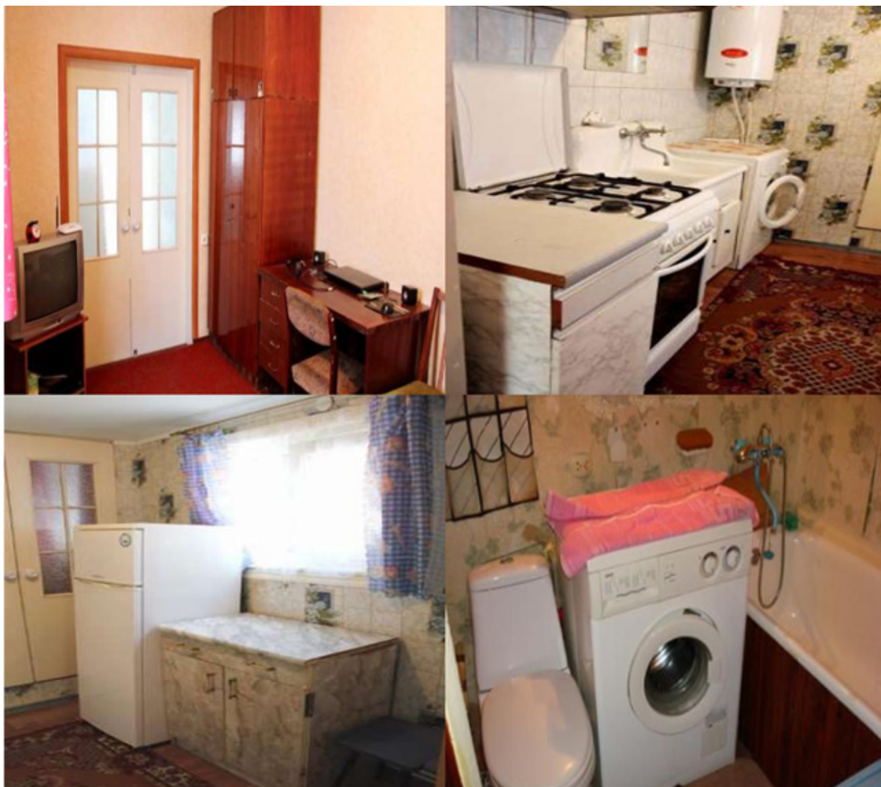
Типові умови життя в пропонованих для оренди квартирах

Жити у гуртожитку – честь для студента, але не завжди тамтешні умови влаштовують «студнів» або їх батьків.