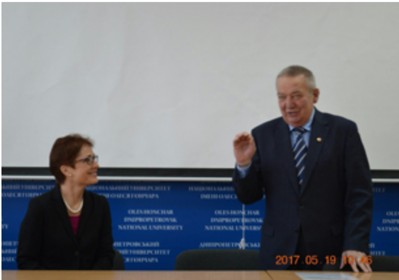
Пані Йованович проводить бесіду зі студентами Дніпровського університету

19 травня до університету ім. Олесь Гончара завітала Надзвичайний і Повноважний Посол США в Україні – пані Марі Йованович. Вона стала першою жінкою, яка очолила дипломатичну місію США в Україні.