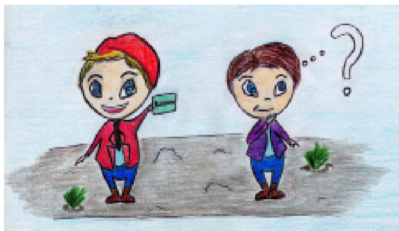
Мати чи не мати диплом? Автор: Марія ТУКАНОВА

Можу з упевненістю сказати, що для якісної роботи в ЗМІ журналісту потрібен не диплом, а бажання, працьовитість і інтерес до постійного навчання, вдосконалення навичок, безперервної самоосвіти. Одна з моїх співробітниць не має диплома взагалі, проте, об'єктивно, на порядок краще розбирається в професії, ніж ті журналісти, що мають декілька дипломів. Важливо розуміти, що журналістика - це щоденна праця, самовдосконалення, а зовсім не «свято», як, на жаль, вважає (як показує практика)