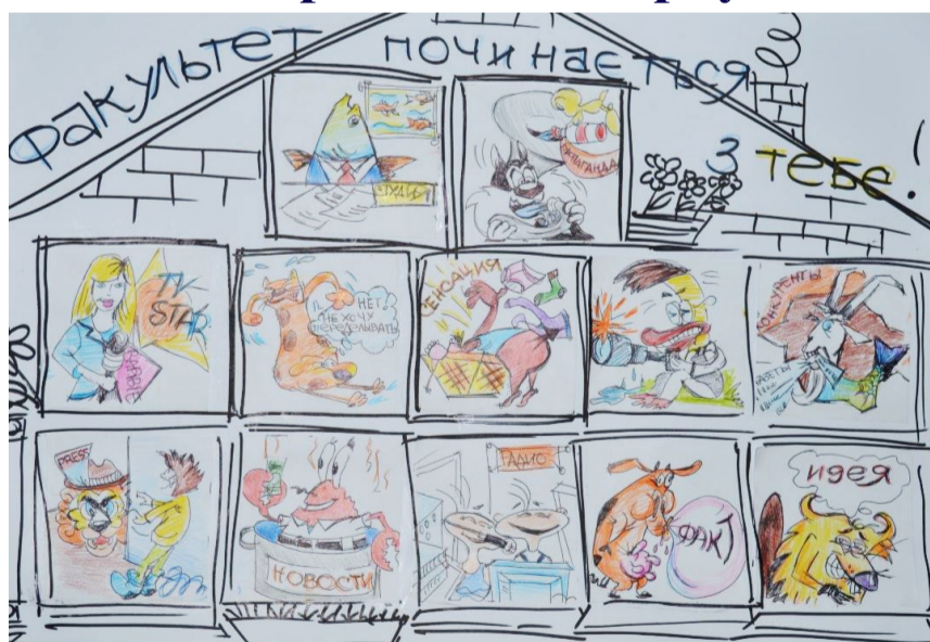
Автор: Світлана Юрченко

Так, можливо будуть клопоти, які намагалися збити Вас з пантелику. Але не треба впадати у відчай – все мінає. Сесія закінчиться, студенти роз'їдуться і Ви зможете спокійно видихнути, а не ховатися від них по закутках кафедри. А студентам-Ракам зірки пропонують швидше перебирати своїми малесенькими клішнями, аби якомога скоріше здати всі роботи і тим самим підняти власний настрій й дати можливість спокійно видихнути викладачам. Лев: Цього місяця Вам треба проявити неспірний ентузіазм до всього, що б Ви не робили. І це не завжди буде супроводжуватися добрими відгуками. Але не звертайте уваги – наприкінці всіх проектів зможете побачити, що попрацювали на славу! Заліки, сесія, загалом, увесь цей «ураган Катріна» - швиденько пройде через це «стихийне лихо» та насолоджуйтесь своєю плідною працею. Студенти, ви можете бути спокійними тільки в тому разі, якщо у Вас все гаразд з балами. Що ви кажете? Не гаразд? Тоді «біжить Форест» хвостиком за викладачем та здавайте все, що тільки можете здати. Діва: Зірки прогнозують Вам неабияку терплячість. Втім, ця риса вже