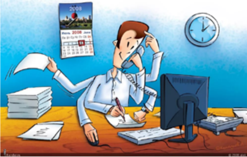
А скільки справ одночасно робите Ви?

Люди стають журналістами з різних причин: хтось відчуває, що це його покликання, когось манить престижність професії, хтось любить «бути в тренді». І мабуть, мало хто приходить у журналістику з метою стати мільйонером, але все ж такі нас всіх цікавлять «грошові питання». Замість того, щоб гадати, якою ж буде наша зарплата за спеціальністю, ми розпитали безпосередньо журналістів Дніпра. Тож, що ми з'ясували.