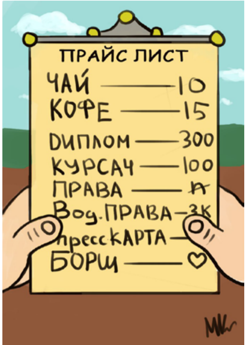
Автор: Максим КИСЛІВ