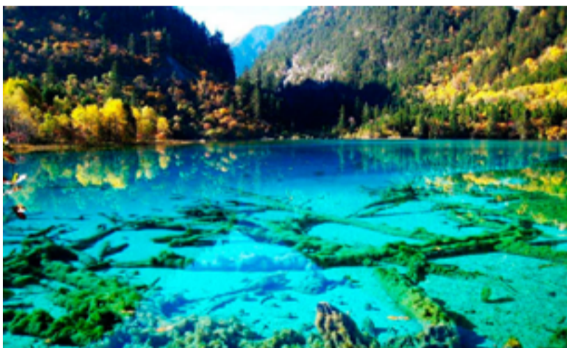
Національний парк Цзючжайгоу

1000 грн - квиток на рок-фест, гарні струни і пара гарних футболок із секунду.