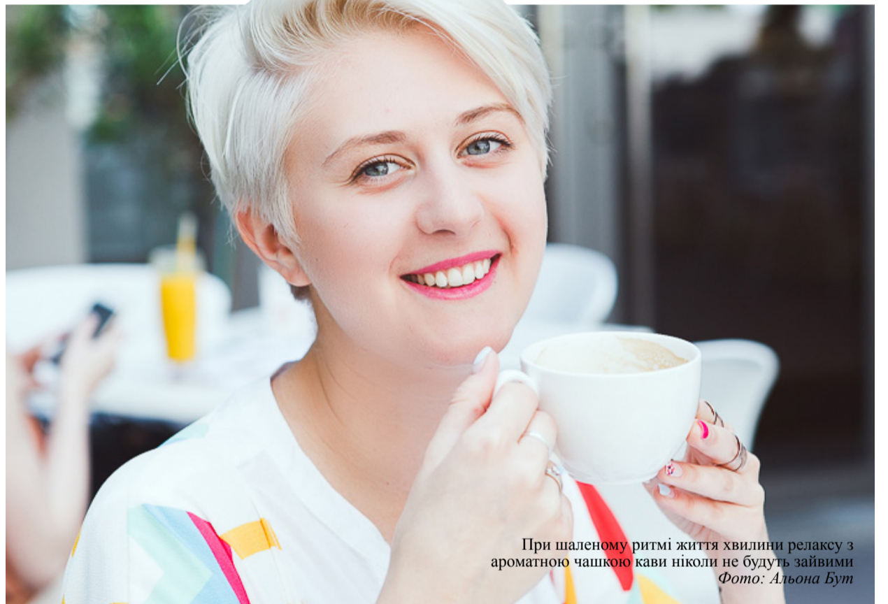
При шаленому ритмі життя хвилини релаксу з ароматною чашкою кави ніколи не будуть зайвими

Ніколи не мала подібних проблем. Ще студенткою я телефонувала до різних компаній, приходила туди й намагалася працювати. Я говорила роботодавцям, що погоджуюся працювати безкоштовно, перекладати папери, аби тільки отримувати справжнє знання. В 2012 році я уже була членом піар-команди музичного фестивалю «The Best City.UA». Отож,