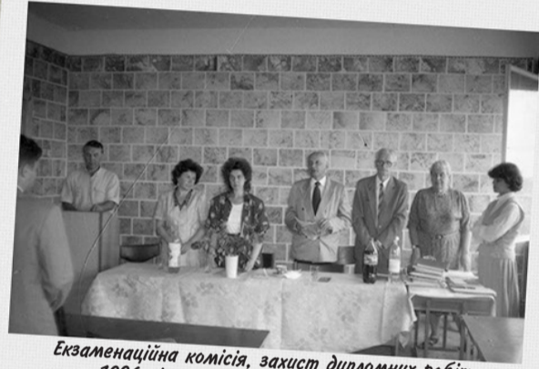
Екзаменаційна комісія, захист дипломних робіт, 1996 рік. Другий випуск спеціальності «Журналістика»