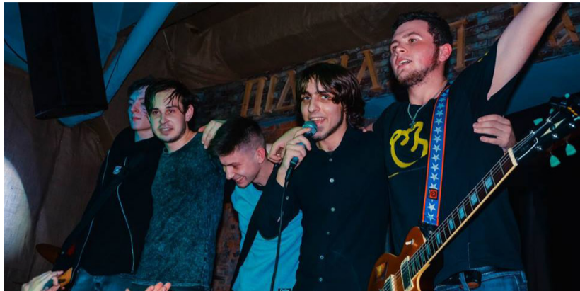
Панк-угар набирає оберті

Вечір середи. Втолені після тяжкого робочого дня безлікі чоловічки відправляються додому. Сидять у своїх сірих коробках, в цьому базатоперховому мурашнику, проводячи вільний час за монітором, і чекають настання наступного такого ж посереднього і гнітючого дня. Геть рушину! Чому б не відвідати справжню панк-тусовку і не відірватися на славу?