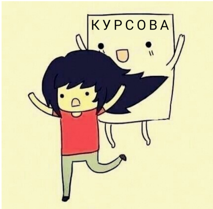
Коли хвилюватись уже немає сил!

Крок 1. Усвідом масштаби. Сядь і добряче поуявляй, як стоїш перед величезною аудиторією і комісією, червоний як помідор і відчайдушно намагаєшся щось там аргументувати і оперувати науковими термінами. А вони всі так дивляться, а ти такий ніяковісш, у всьому тілі від хвилювання пульсує, мозок видає «Етгог 404». Істерика, істерика, істерика. Уявило? Попий водички, має полегшати.