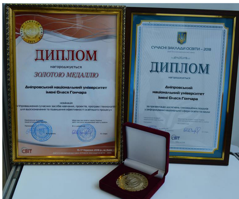
Дипломи переможців почесного конкурсу

ДНУ переміг на Міжнародній виставці «Сучасні заклади освіти»