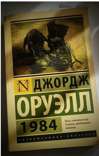
Джордж Орвелл «1984»

героїв, яких ми не знаємо. Цей фільм поза всіма рейтингами, адже це пам'ять. Пам'ять про людину, яка подібно до Мойсея вивела євреїв з пекла. «Собибор» вартий уваги, адже не так багато людей знають про даний концтабір. А це одна зі сторінок багатостраждальної історії євреїв.