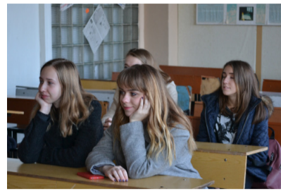
Коли дуже цікаво! (увага на другу парту)