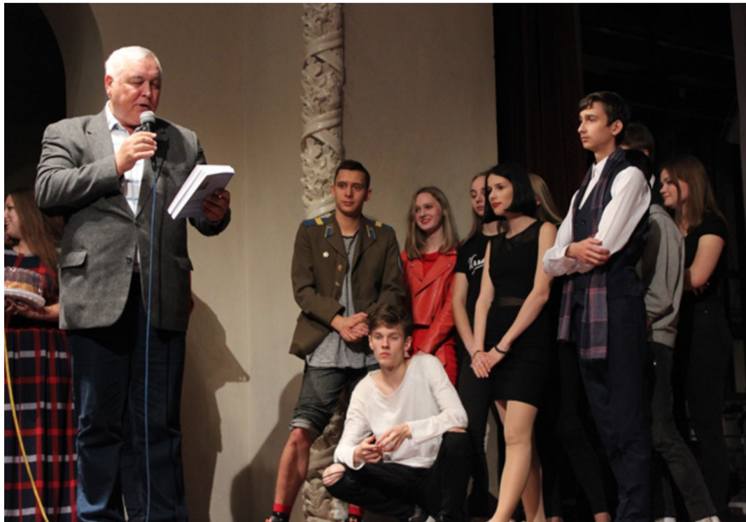
Студентів чекає сюрприз

Як в цьому році дебютували першокурсники?