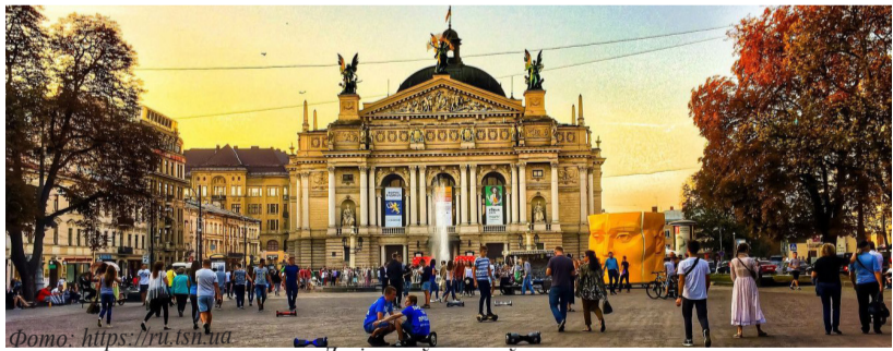
Львівський оперний театр

Місто, у якому, якщо вірити чулкам, варять найсмачнішу в Україні каву. Про нього також можна сказати, що найгарніше можна побачити повністю безкоштовно. Гості міста намагаються відвідувати Львів взимку, адже саме під час зимових свят із своїми старовинними вуличками і неповторною атмосферою, місто стає просто казковим.