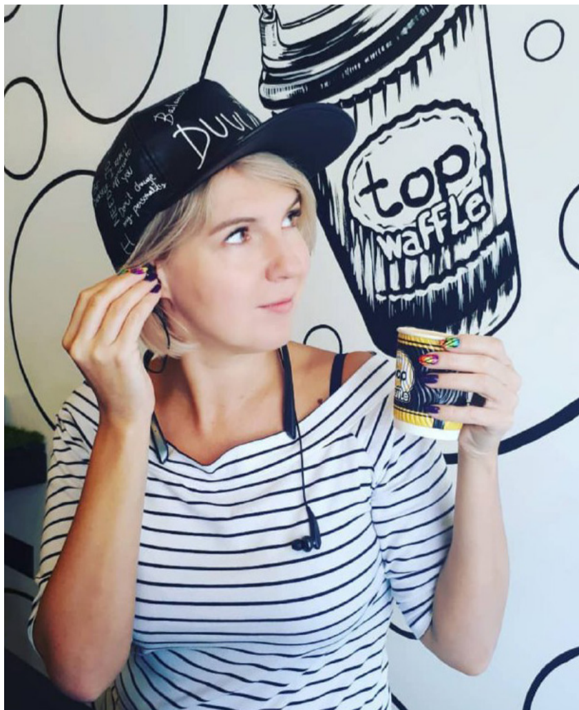
Перерва між записами на радіо