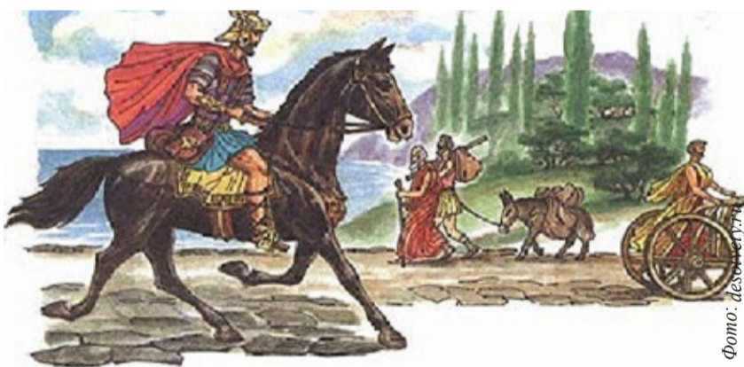
Римські гінці - швидкі та витривалі

Сучасна пошта пройшла велику путь - від обвітраних рук табеларіїв, до сучасних дисплеїв телефонів