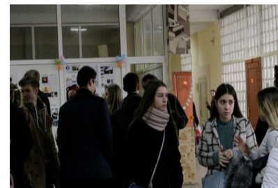
Школярі з інтересом щось обговорюють