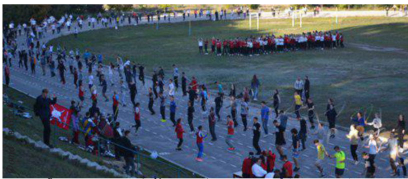
Встановлення рекорду України з одночасних стрибків на скакалці

ДНУ вирішив в незвичний спосіб відсвяткувати свій ювілей. Майже тисяча студентів стрибала на стадіоні на скакалці, аби встановити новий рекорд України.