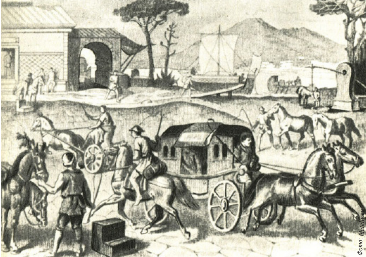
Важкі робочі будні табеларія

Про важку роботу поштаря античності та чому нічого принципово нового придумати не можна