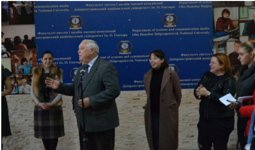
Декаан говорить, всі «слухають»

Дізнатися цікаве про професію журналіста та будні студентів ФСЗМК — просто. Достатньо лише завітати на факультет журналістики ДНУ, де відбулось створення медіа-школи «Студія HONCHAR-MEDIA».