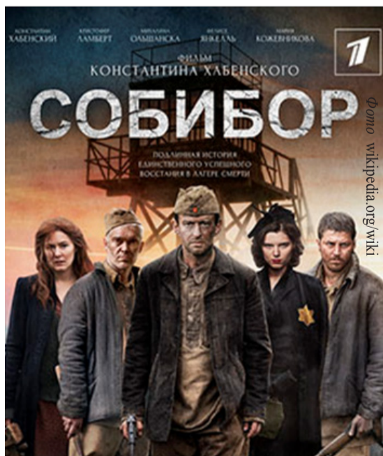
Афіша фільму «Собибор»

У 2018 році відзначається 75-річчя з дня героїчного подвигу в'язнів концтабору Собибор. На честь цього в кінопрокат вийшла історична драма К.Ю. Хабенського «Собибор».