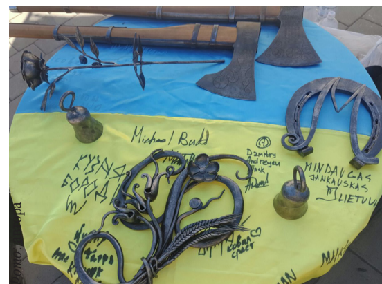
З Україною в серці: сучасне мистецтво