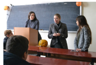
Розповідаємо про студентське життя в холодній аудиторії