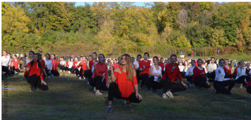
Танцювальний флешмоб за участі студенток ДНУ