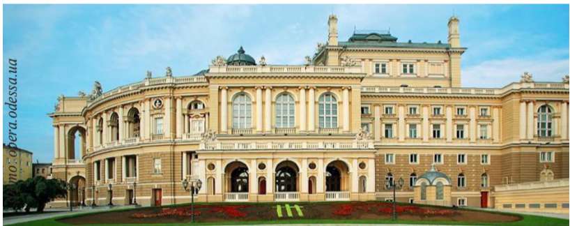
Одеський національний академічний театр опери та балету

Невимовно гарна і колоритна, та ще й на березі моря. Це місто із чарівною архітектурою вабить туристів не тільки влітку, отже, чому б не зібратися туди їхати просто зараз?